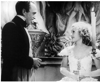
1932 MOI ET L'IMPÉRATRICE (Ich und die Kaiserin) de F. Hollander avec Lilian Harvey