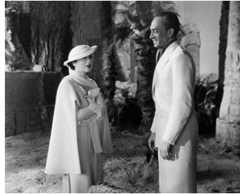
1934 BELLA DONNA (Bella Donna) de Robert Milton avec Mary Ellis