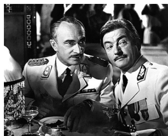
1942 CASABLANCA (Casablanca) de Michael Curtiz avec Claude Rains