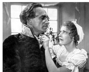
1932 LE HUSSARD NOIR (Der schwarze Husar) de Gerhard Lamprecht avec Mady Christians