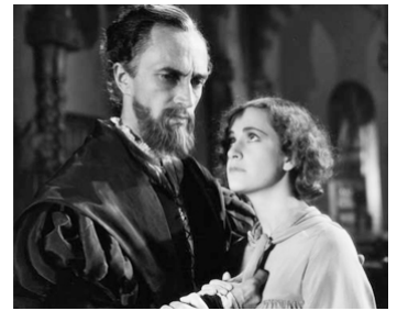
1933 LE JUIF ERRANT (The Wandering Jew) de Maurice Elvey avec Peggy Ashcroft