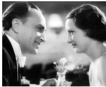
1933 I.F.I NE RÉPOND PLUS (F.P.I) de Karl Hartl avec Jill Esmond