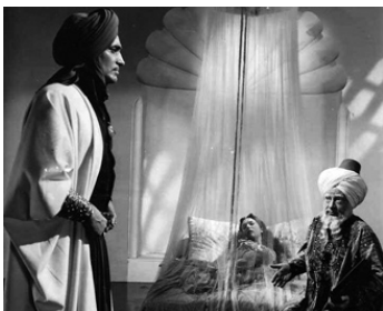
1940 LE VOLEUR DE BAGDAD (The Thief of Bagdad) de M. Powell avec June Duprez