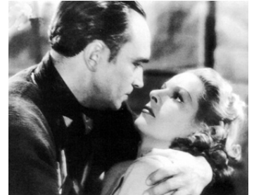
1938 TEMPÊTE SUR L'ASIE de Richard Oswald avec Madeleine Robinson