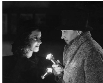
1939 ESPIONNE À BORD (Contraband) de Michael Powell avec Valerie Hobson