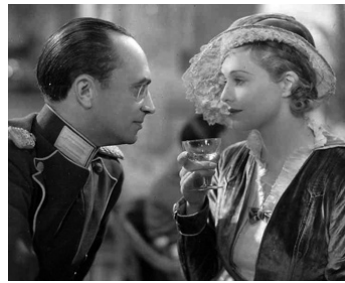
1933 J'ÉTAIS UNE ESPIONNE (I was a Spy) de Victor Saville avec Madeleine Carroll