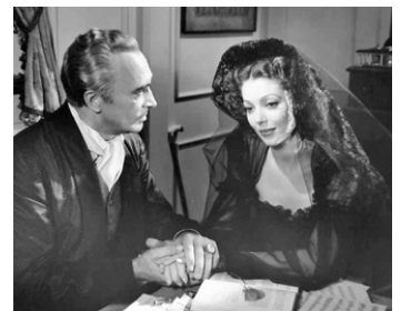
1941 LA ROSE BLANCHE (The Men in her Life) de Gregory Ratoff avec Loretta Young