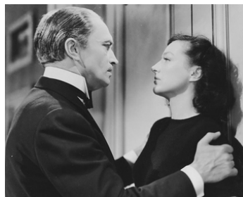
1940 IL ÉTAIT UNE FOIS (A Woman's Face) de George Cukor avec Joan Crawford