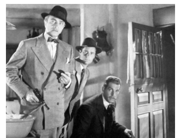
1943 UN ESPION A DISPARU (Above Suspicion) de R. Thorpe avec Bruce Lester, F. MacMurray