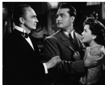
1941 ALERTE SUR LES ONDES (Whistling in the Dark) de S. Simon avec R. Skelton, A. Rutherford